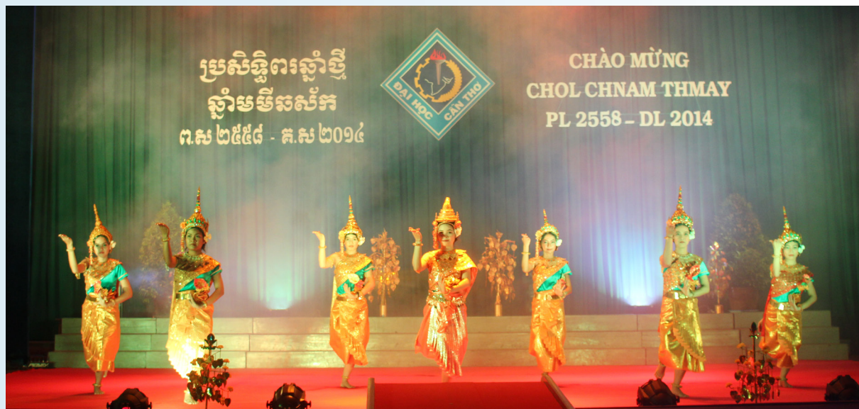
Tiết mục biểu diễn đặc sắc của các em sinh viên dân tộc Khmer.

Đêm 06/4/2014, Trường Đại học Cần Thơ (ĐHCT) đã tổ chức đêm sinh hoạt văn hóa-nghệ thuật “Mừng Tết cổ truyền Chol Chnam Thmay” tại Hội trường Lớn. Tham dự chương trình có các đại biểu đại diện lãnh đạo Ban Chỉ đạo Tây Nam Bộ, Cục An ninh Tây Nam Bộ, Vụ Địa phương 3; Ban Dân tộc, Hội đoàn kết sư sãi yêu nước các tỉnh, thành Đồng bằng sông Cửu Long, Phòng PB11-Công An Thành phố Cần Thơ. Phía Trường có Đảng ủy, Ban Giám hiệu, đại diện lãnh đạo và cán bộ chuyên trách các đơn vị, đoàn thể, cán bộ và sinh viên Trường, đặc biệt với sự tham gia của hơn 1.000 cán bộ và sinh viên dân tộc Khmer.