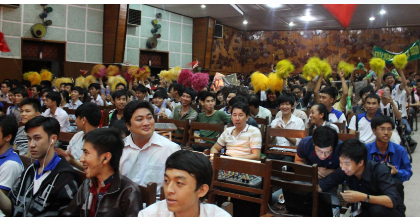
Sự cổ vũ nhiệt tình của cổ động viên các đội.

Ngoài ra, Ban Tổ chức đã trao nhiều giải thưởng khuyến khích cho 25 sinh viên dự thi đạt điểm cao, đặc biệt khen thưởng các đơn vị đã tuyên truyền tốt cho cuộc thi, có đồng đảo sinh viên tham gia là Đoàn khoa Khoa Phát triển Nông thôn và Đoàn Khoa Công nghệ.