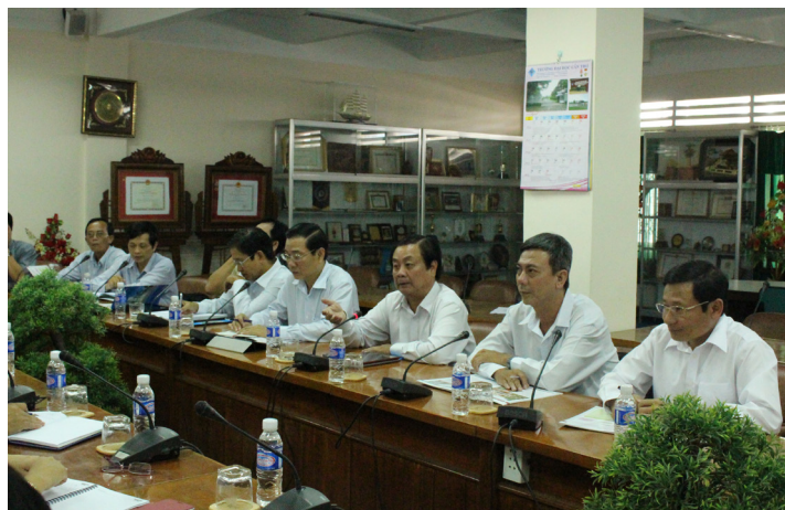
Đoàn công tác tỉnh Đồng Tháp do ông Lê Minh Hoan, Chủ tịch UBND tỉnh làm trưởng đoàn thảo luận hợp tác với Trường.

Trao đổi tại buổi làm việc, lãnh đạo Trường đã bày tỏ sự ủng hộ và sẵn sàng hợp tác, hỗ trợ tỉnh Đồng Tháp về tất cả các công tác liên quan đến việc tái cơ cấu phát triển kinh tế xã hội của tỉnh. Bên cạnh đó, nhà trường đánh giá cao sự phối hợp, hợp tác nhịp nhàng, hiệu quả giữa Trường và tỉnh Đồng Tháp trong thời gian qua, đặc biệt là công tác nghiên cứu triển khai ứng dụng thực tiễn cũng như việc đào tạo nguồn nhân lực phục vụ nhu cầu của tỉnh. Trong thời gian tới, Trường ĐHTC sẽ phối hợp chặt chẽ với tỉnh Đồng Tháp để tiếp tục thảo luận chi tiết và cụ thể về công tác hợp tác và phối hợp giữa hai đơn vị.