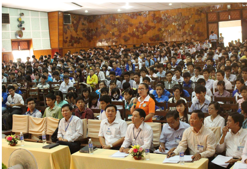
Buổi tọa đàm đã thu hút sự tham gia đông đảo của cán bộ và sinh viên Trường.

trường nhấn mạnh điều quan trọng nhất trong mọi nỗ lực của Trường là tạo môi trường học tập và làm việc ngày càng tốt hơn cho toàn thể cán bộ và sinh viên.