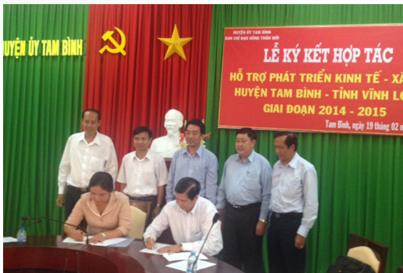
Ký kết hợp tác nghiên cứu với huyện Tam Bình - tỉnh Vĩnh Long.

Trong năm 2013, cán bộ Khoa đã thực hiện 04 đề tài cấp trường với tổng kinh phí là 179 triệu đồng; tham gia đề xuất đề tài cấp Bộ năm 2014 và có 03 đề tài được Bộ chọn đưa vào vòng dự tuyển với báo cáo thuyết minh; có 06 đề tài do sinh viên Khoa đăng ký được Trường xét duyệt thực hiện trong năm 2013 với kinh phí là 151 triệu đồng; tổ chức được 29 hoạt động báo cáo chuyên đề (seminar); phối hợp với các đơn vị trong và ngoài trường tổ chức nhiều hội thảo. Năm 2014, Khoa có thêm 06 đề tài cấp trường của cán bộ với kinh phí là 300 triệu; 05 đề tài sinh viên được đề xuất thuyết minh; và 04 seminar được thực hiện.