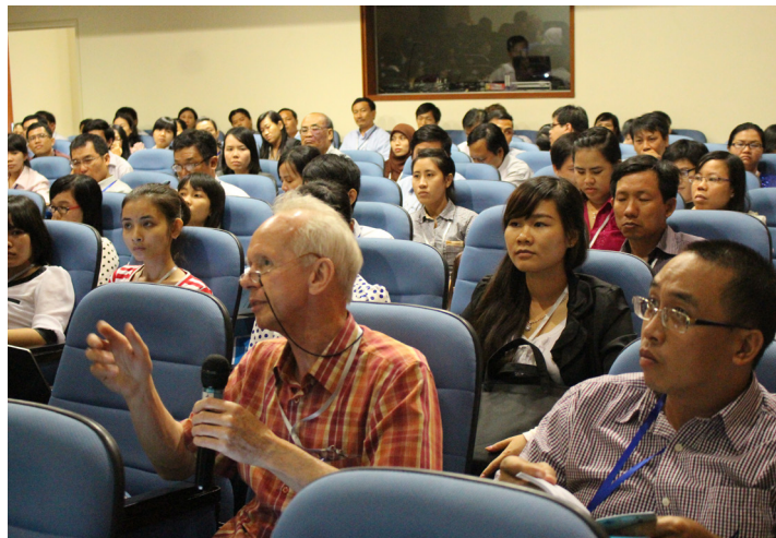
Các đại biểu thảo luận và trao đổi ý kiến tại Hội thảo.

Kết quả nghiên cứu cho thấy, trong thời gian 28 ngày sau khi sử dụng thì lưu lượng chất bảo vệ thực vật và kháng sinh không còn tồn lưu trong nước, đồng thời tồn lưu của các chất hóa học này trong động vật thủy sản giảm xuống dưới mức nồng độ cho phép. Dự án cũng thử nghiệm thành công hoạt động nuôi trồng thủy sản đảm bảo an toàn thực phẩm thông qua sử dụng nguồn thức ăn tự nhiên kích thích miễn dịch cho động vật thủy sản, làm tăng khả năng miễn dịch tự nhiên, hạn chế việc sử dụng chất kháng sinh trong nuôi trồng thủy sản.