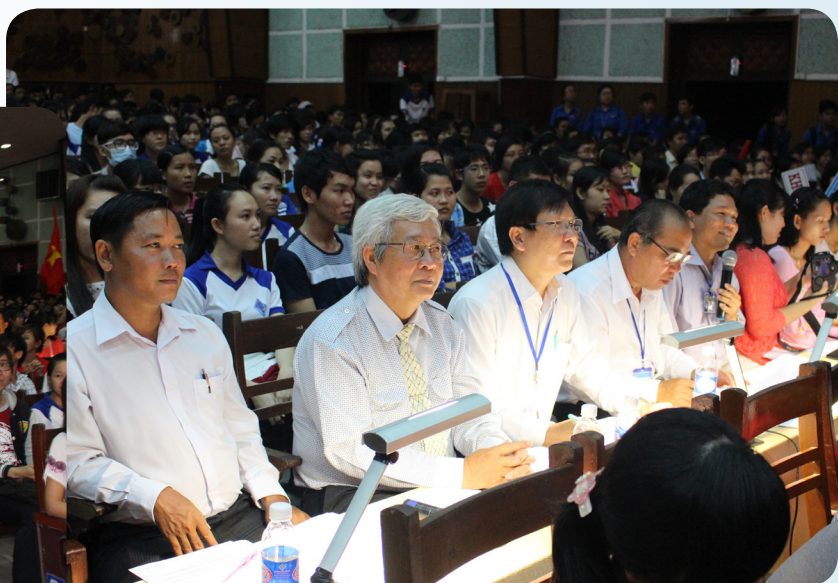
Ban Giám khảo của cuộc thi.

Các phần dự thi được các em sinh viên thể hiện rất hào hứng, sôi động, lý thú và vô cùng ý nghĩa. Cuộc thi đã thể hiện được niềm đam mê, sự sáng tạo, tự tin, bản lĩnh và sự năng động, nhiệt huyết của tuổi trẻ Trường ĐHCT, với tinh thần học tập hăng say, vui chơi hết mình và không ngừng học hỏi để tiến bộ. Những câu chuyện được kể từ các thí sinh cũng là cơ hội để các em sinh viên Trường có thêm được nhiều bài học bổ ích về những lời dạy giản dị, gần gũi của Bác thông qua từng câu chuyện