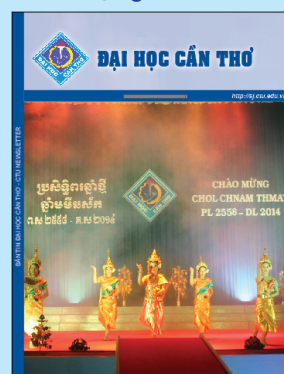
Ảnh bìa 1: Mừng Tết cổ truyền Chol Chnam Thmay