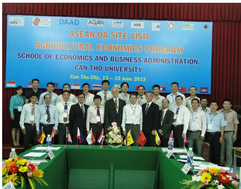
Ảnh lưu niệm tại buổi làm việc với đoàn đánh giá AUN.

Niềm phấn khởi với kết quả chứng nhận chương trình đầu tiên đạt chuẩn AUN cũng như những bài học kinh nghiệm tích lũy được về công tác đảm bảo tiêu chuẩn chất lượng giáo dục khu vực ASEAN trong lần tổ chức đánh giá ngoài vừa qua sẽ tạo động lực rất lớn giúp tập thể nhà trường có thêm niềm tin tiếp tục triển khai các chương trình đánh giá ngoài tiếp theo. Trong năm 2014, Trường tiếp tục chuẩn bị, xúc tiến triển khai công tác đánh giá ngoài theo tiêu chuẩn AUN đối với hai chương trình đào tạo