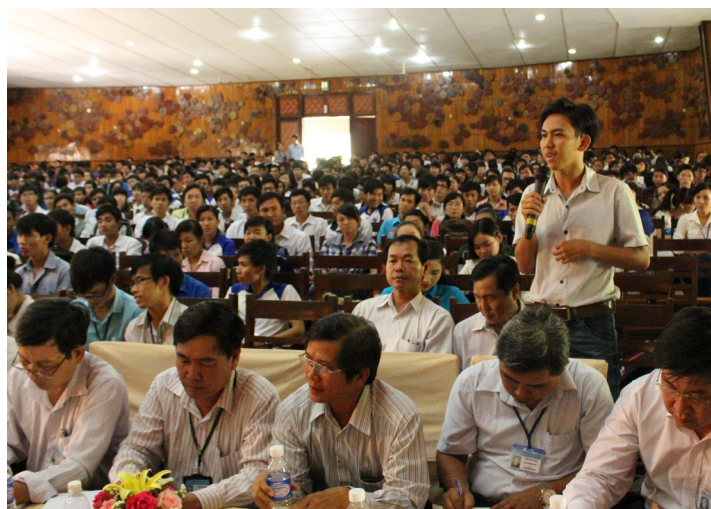
Sinh viên trình bày vướng mắc của các em đến Đảng ủy-Ban Giám hiệu.

Những thông tin phản hồi của lãnh đạo Trường sẽ được công bố chính thức đến toàn thể sinh viên. Nhà trường luôn hoan nghênh và sẵn sàng tiếp nhận, phản hồi ý kiến đóng góp của các em, tạo điều kiện ngày càng tốt hơn cho hoạt động học tập và rèn luyện của sinh viên, hỗ trợ các em tích lũy kiến thức và rèn luyện những kỹ năng cần thiết cho nghề nghiệp tương lai.