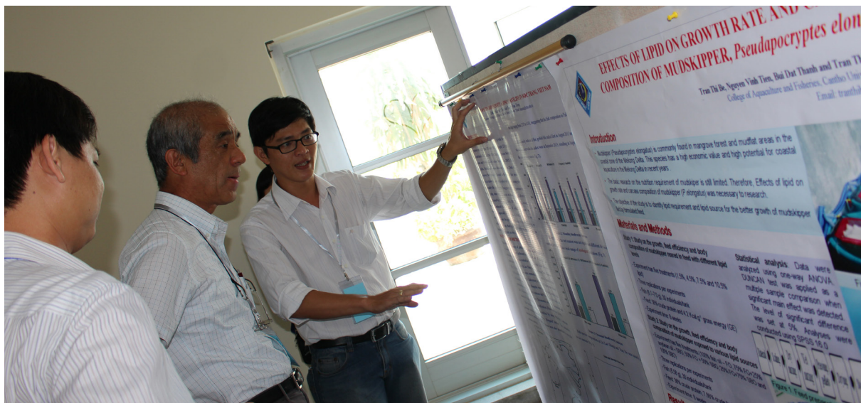
Tham quan tìm hiểu các kết quả nghiên cứu được trình bày bằng poster.

Dự án “ Deltaquasafe ” đã được triển khai thành công với nhiều kết quả quan trọng có lợi cho sản xuất thủy sản, đóng góp cho sự phát triển kinh tế thủy sản của Việt Nam, hướng đến nuôi trồng thủy sản bền vững nhờ giảm đáng kể lượng hóa chất sử dụng trong phòng trị bệnh thủy sản, tiết kiệm chi phí cũng như đảm bảo an toàn thực phẩm, an toàn sức khỏe người tiêu dùng, bảo vệ môi trường, góp phần nâng cao khả năng cạnh tranh của thủy sản Việt Nam. Thông qua kết quả Dự án, các nhà nghiên cứu sẽ phát triển các tài liệu hướng dẫn cho các hộ, các trại nuôi về quy trình nuôi trồng và sản xuất, chế biến thủy sản an toàn, hướng các chuyên viên phân tích về quy trình phân tích, xử lý mẫu trong nghiên cứu có liên quan. Dự án đã đào tạo được 03 tiến sĩ, 15 thạc sĩ và nhiều sinh viên đại học ngành thủy sản và môi trường.