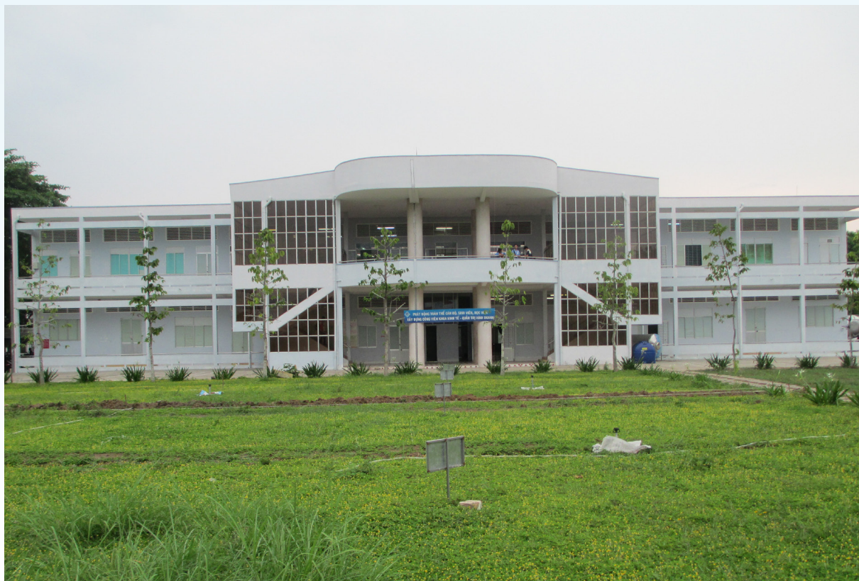
Khuôn viên của Khoa KT & QTKD.

Chất lượng đào tạo là mục tiêu hàng đầu của Khoa KT&QTKD nhằm cung cấp nguồn nhân lực có chất lượng cao đáp ứng nhu cầu phát triển kinh tế-xã hội của đất nước. Năm 2013, ngành Kinh tế nông nghiệp bậc đại học của Khoa đã đạt chuẩn AUN (ASEAN University Network)-Hệ thống các trường đại học Đông Nam Á. Khoa sẽ tiếp tục cải tiến và nâng cao chất lượng đào tạo, phấn đấu để tất cả các ngành bậc đại học đều đạt chuẩn AUN.