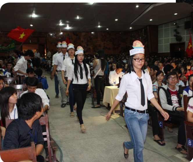
Các đội tự tin bước lên sân khấu dự thi.

cá nhân, mỗi thí sinh sẽ chọn thể hiện một câu chuyện tâm đắc về tấm gương đạo đức Chủ tịch Hồ Chí Minh, qua đó liên hệ thực tế và trả lời câu hỏi từ phía Ban Giám khảo.