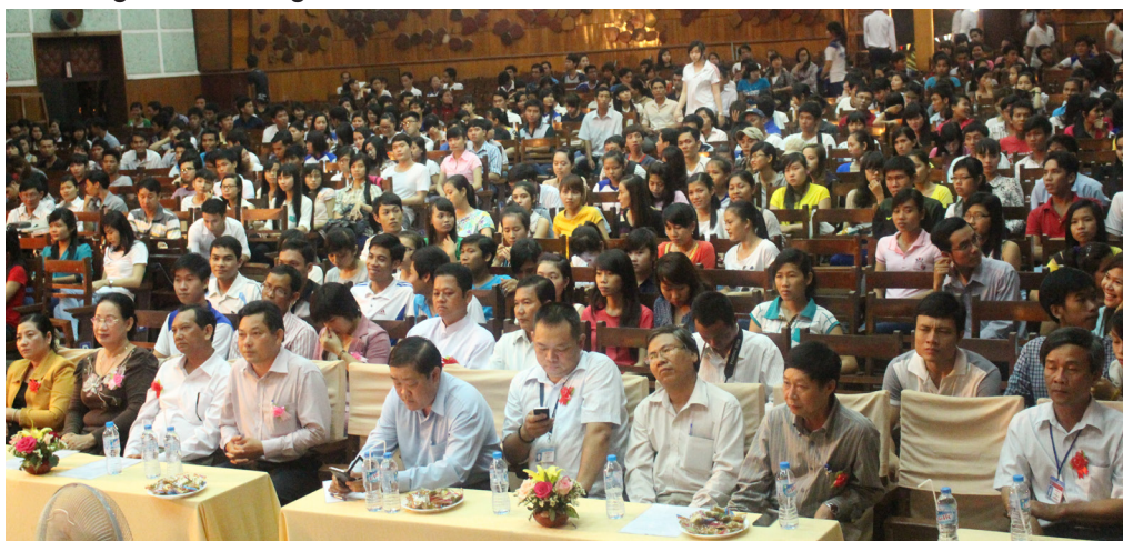
Các đại biểu và sinh viên tham dự Chương trình giao lưu mừng Tết cổ truyền Chol Chnam Thmay.

Hiểu được hoàn cảnh khó khăn của sinh viên đồng bào dân tộc Khmer, nhà trường luôn tạo điều kiện thuận lợi nhất cho các em tham gia học tập và rèn luyện tại Trường. Hằng năm, Trường tạo điều kiện cho sinh viên dân tộc Khmer tổ chức các buổi giao lưu sinh hoạt Văn hóa-Nghệ thuật nhân dịp mừng Tết cổ truyền Chol Chnam Thmay, Lễ Sen-Dota, giúp sinh viên các dân tộc khác hiểu hơn về bản sắc văn hóa của dân tộc Khmer qua đó thắt chặt hơn nữa tình đoàn kết giữa sinh viên các dân tộc trong Trường; ưu tiên xét duyệt, sắp xếp chỗ ở Ký túc xá cho các em nếu có nhu cầu, tạo điều kiện thuận lợi cho các em học tập, sinh hoạt, rèn luyện, giúp các em tiết kiệm chi phí; đến nay đã có 886/1.527 sinh viên dân tộc Khmer được cư trú trong khu Ký túc xá của Trường.